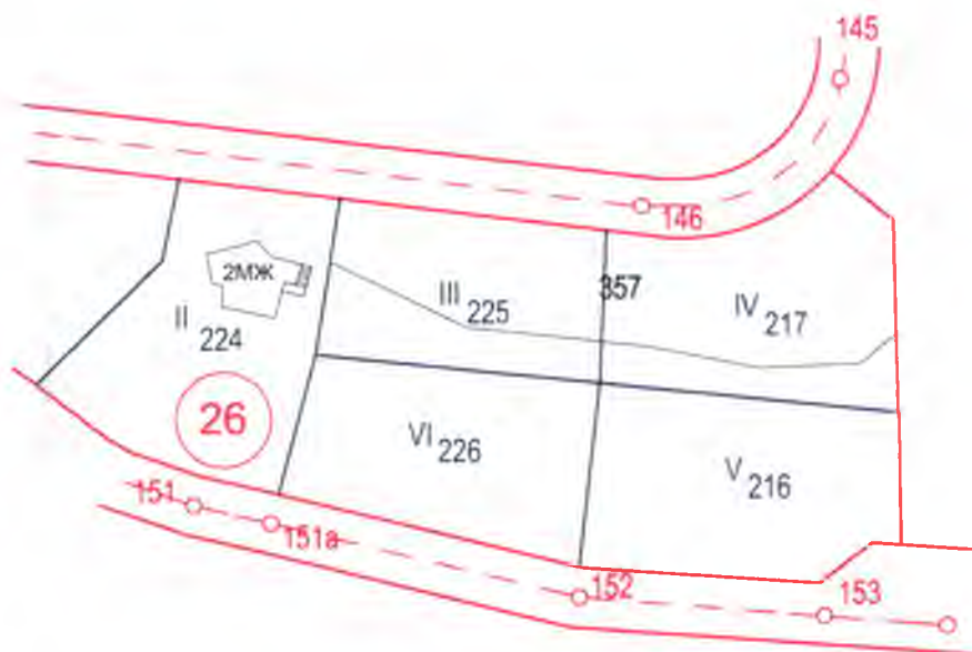
Извадка от действащия регуляционен план на с. Стоките М 1:1000