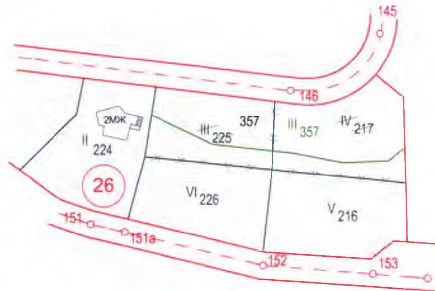
ПРЗ за частично изменение на ЗРП за част от кв. 26 по плана на с. Стоките Регуляционна съставка М 1:1000